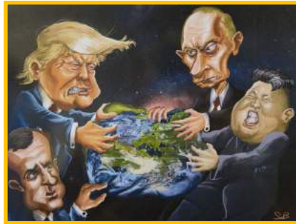
Prix du public : SEB

Une belle manifestation et une clôture avec une remise des prix en présence d'élus, dans une ambiance festive !